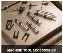
MACHINE TOOL ACCESSORIES