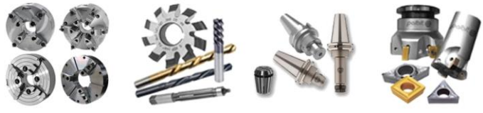
End Mills : Drills : End mills : Burrs : Taps : CAT Shank Holders : Cut Off, Threading, and Grooving Systems