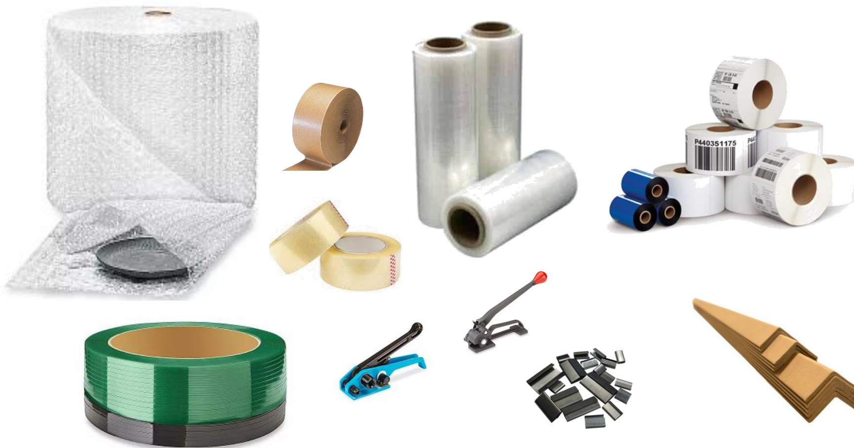
Cinta gorila, emplaye, cinta transparente, etiquetas, ribbons fleje metálico / plástico, grapas, trapo industrial